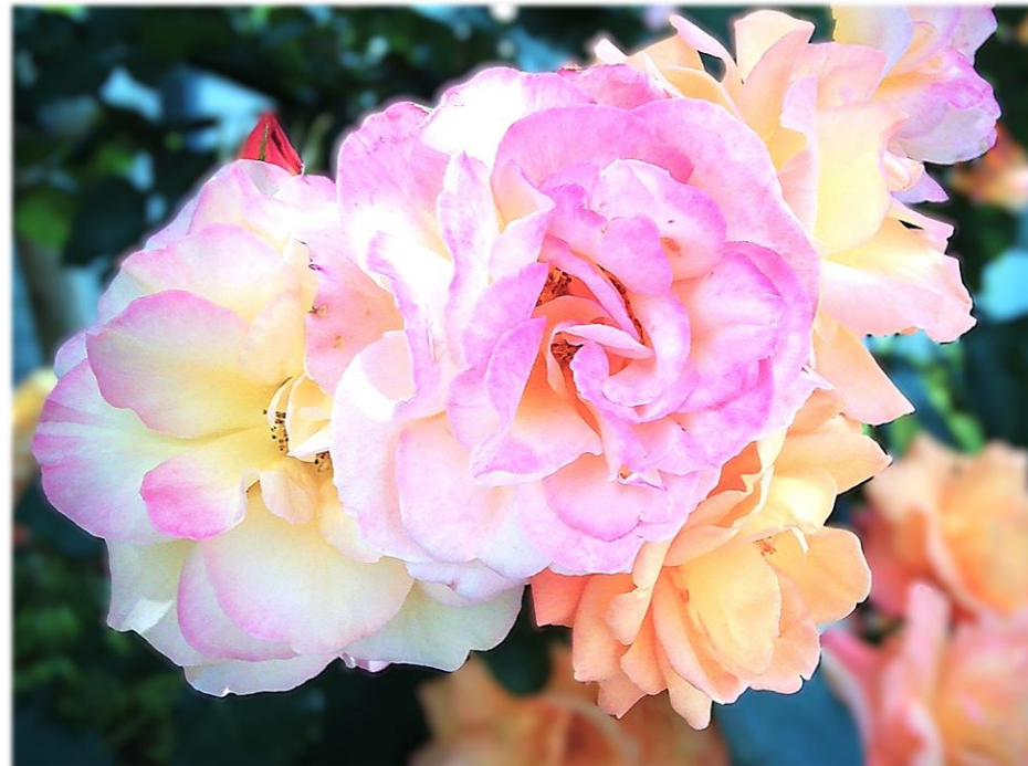
アソネのバラがきれいに咲きました