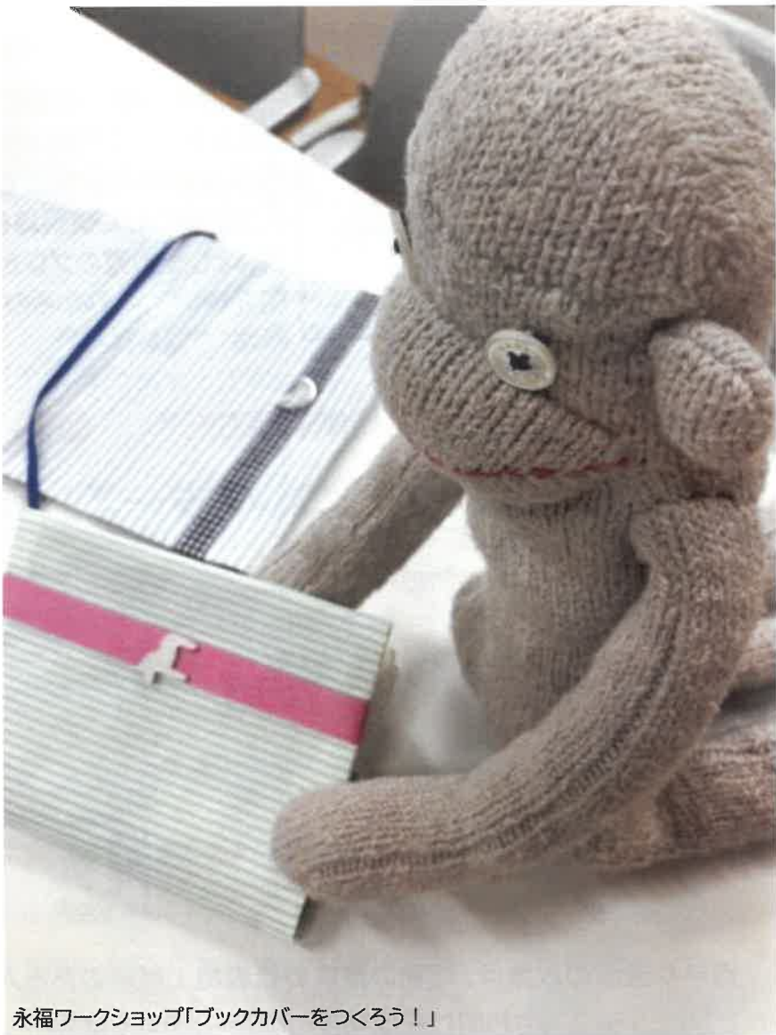
永福ワークショップ「ブックカバーをつくろう！」