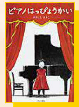
『ピアノはっぴょうかい』

つんつくむらのわたり鳥(どり)は、遠(とほ)い北(きた)の国(くに)で夏(なつ)をすごし、毎年(まいとし)秋(あき)になると、またむらにやってくる。きつねのこんくんは、秋(あき)になったらみずうみで音楽(おんがく)はっぴょう会(かい)をしようと、わたり鳥(どり)たちのおとずれをまちのぞんでいましたが…。