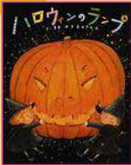
『ハロウィンのランプ』

『ハロウィン』ってきくとなんだか、ワクワク!ドキドキ!してくるね。ことしはどんなたのしいことがおこるかな?ハッピーハロウィン!!