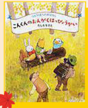
『こんくんのおんがくはっぴょうかい』

おいしいあき、おでかけのあき、げいじゅつ(え・おどり・おんがく…)のあき。あきはワクワクすることがいっぱいだね。あきをいっぱいたのしんでね!