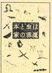
[914]評論・エッセイ・随筆

通天閣とサバンナとサイ、別府地獄のかバとワニ、大須観音商店街のラクダ行列…。さまざまな動物園を巡ってきた著者が、行く先々の風景からヒトと動物との関係を考える。東京大学出版会の『UP』誌連載をもとに書籍化。