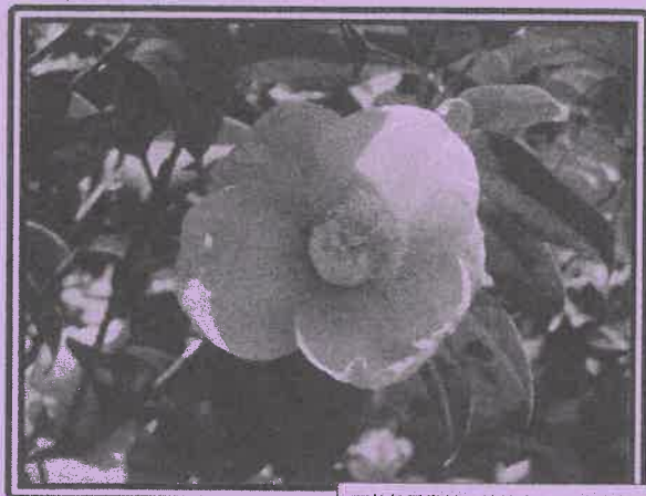
下井草図書館の草花(入口脇・射撃場) つばき