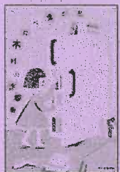
[914]評論・エッセイ・随筆

できていたプレーが突然できなくなる…。野球に焦点を当てつつ、謎多き病「イップス」の正体に迫り、克服の具体的な方法に言及する。指導者やプロ野球選手のインタビューも収録。『ニッカン・コム』連載を加筆・修正。