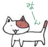
みやたくん家のねこ