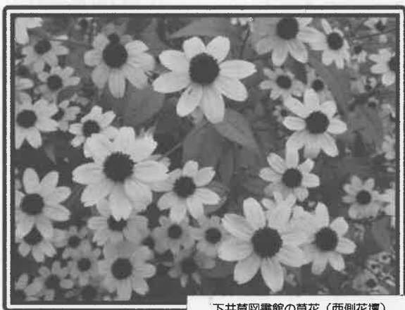
下井草図書館の草花（西側花壇） ルドベキア タカオ