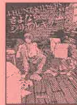
『さよなら、シリアルキラー』

ジャズの親友。血液凝固因子のない血友病患者。不意に出血したりわずかな刺激で出血したりするので日常生活には細心の注意が必要だが、常に明るく快活で冗談好き。