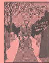
『ラスト・ウィンター・マダー』