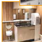
授乳室あります（2階エレベーター前）