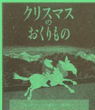
クリスマス のおくりもの

ぼくのパパは、サンタクロース。だから、 クリスマス・イブは いつも ひとりぼっち。 「ことしは、パパと いっしょに いられますように」と ほしに おねがいます。