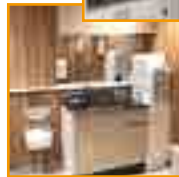
授乳室あります（2階エレベーター前）