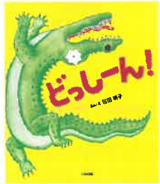
ECちゃいろのシール