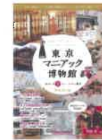
『東京マニアック博物館』 新装改訂版