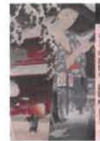
『もっと知りたい! 瀬巴水と新版画』 アート・ビギナーズ・コレクション