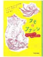
『クモのアナウンシ』 ジャマイカのわかしぼなし