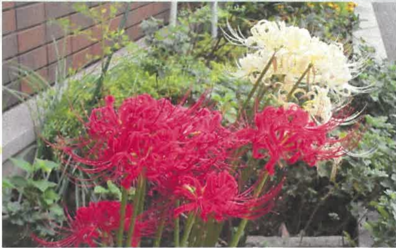
～下井草図書館の花～ ヒガンバナ（西側花壇）