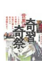
『世界の奇習と奇祭』

日本の出版業界が採用する再販制度。新刊本の価格を維持する、その特異なシステムの歴史と役割とは。