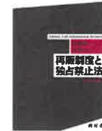
『再販制度と独占禁止法』