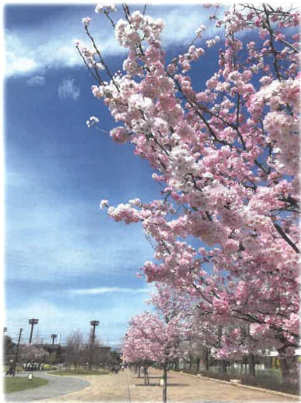
下高井戸おおぞら公園