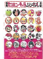
『日本カンパニーキャラ &シンボル大全』