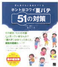
『ホントはコワイ夏バテ51の対策』福田千晶/監修 日東書院本社 498.3ニ

軽く湯船に浸かることはシャワー浴よりはるかに睡眠に効果的と言われています。寝ている間の熱中症予防のためにも扇風機やエアコンで室内を調節して眠りましょう。