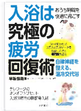
『入浴は究極の疲労回復術』早坂信哉/著 山と溪谷社 498.3ハ