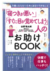
『「寝つきが悪い」「すぐに目が覚めてしまう」人の助けBOOK』白濱龍太郎/著 主婦の友社 498.3シ