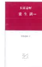
『養生訓』ほか 貝原益軒/著 松田道雄/訳 中央公論新社 121.5カ