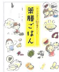
『薬膳ごはん』カラダが変わる80の簡単レシピ 杏仁美友/著 大和書房 498.5キ

二千年以上前に書かれた最古の医学書『黄帝内経 素問』には『夏の三ヶ月を「蕃秀（ばんしゅう）」と言い、早寝早起きをし、太陽を嫌わず、気持ちを愉快地に保ち、怒らず、活動して、体内の気を排泄させることが夏の養生の道である』と説かれています。冷房の温度を急激に下げるよりも、夏野菜や高タンパク質の食べ物で体内に蓄積している熱を逃がしましょう。胃腸の負担の少ない食事は栄養不足と疲労回復も助けます。