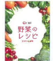
『野菜のレシピ 2021・春夏号』杉並保健所健康推進課 S11.59ホ