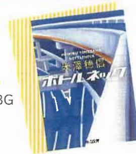
『ボトルネック』 米澤穂信/著 新潮文庫 BG