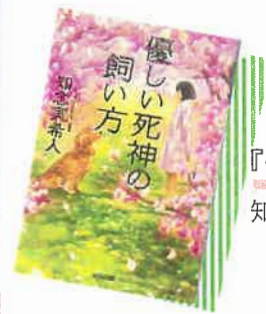
『優しい死神の飼い方』 知念実希人/著 光文社 BG