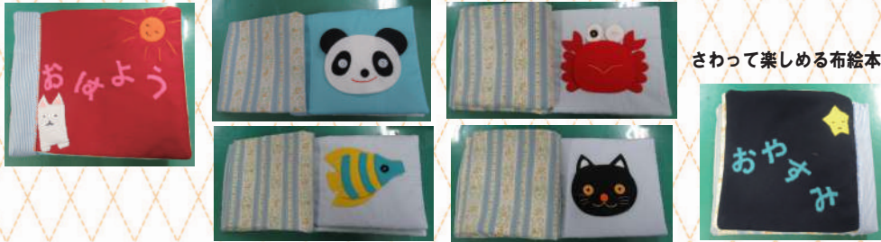
さわって楽しめる布絵本