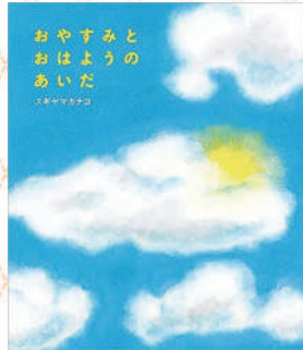
『おやすみとおはようのあいだ』 スギヤマカナヨ / 著 めくるむ ECす