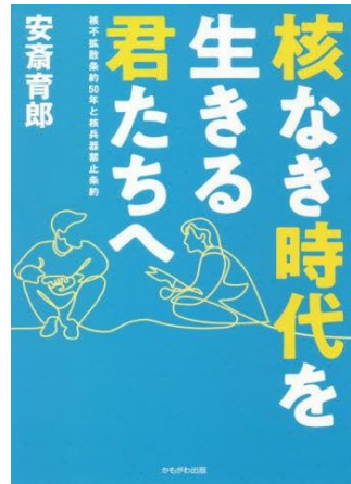
『核なき時代を生きる 君たちへ』