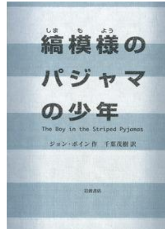
『縞模様の パジャマの少年』