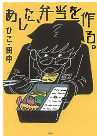
『あした、弁当を作る。』