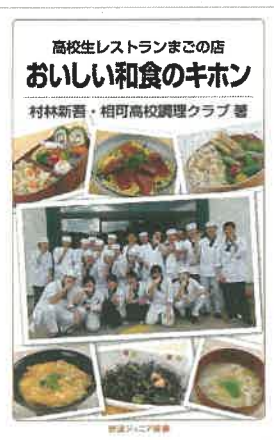
『おいしい和食のキホン 高校生レストランまごの店』