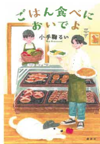
『ごはん食べにおいでよ』