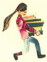
奥原さんのコラージュ

館内にある利用者端末機「OPAC」やパソコン、スマートフォンから杉並区立図書館HPにてご自身の利用状況が分かるマイライブラリーはご存知でしょうか? 返却期日や予約状況の確認ができ、「読書記録」を設定していただくとその日以降に貸出した資料を記録することができます。図書館利用カードのバーコードも表示できますので是非ご活用ください。(事前にパスワードの登録が必要です。詳しくは図書館ホームページ又は図書館のスタッフにお尋ね下さい。)