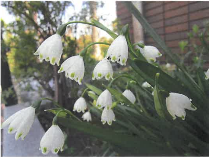
～下井草図書館の花～ スノーフレイク(西側花壇)