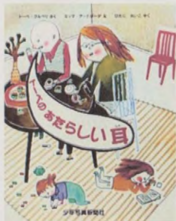
イラスト: ひなまつり

さくしゃのトーベさんが こどもの ときのおはなし。 みみが きこえにくかったトーベは、 びょういんに いって ほちょうきを つけることになります。