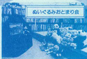
みんなのぬいぐるみがとしょかんにおとまりしました。このしゃんはおはなしかいのようすです。