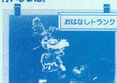
パペットシアターランクさんの「うしかたとやまんぼ」。すごいはりよくて、みんなだいまんぞく！小学生のみなさん 大かんげいのイベントです。