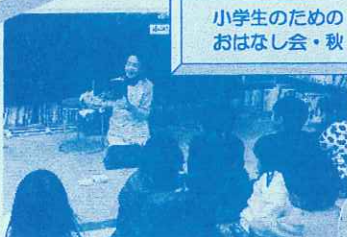
たくさんの小学生が参加してくれました。春もおたのしみに!!