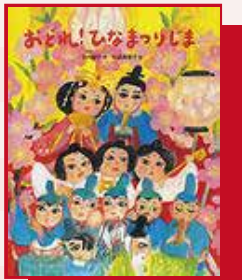
『おどれ！ひなまつりしま』

もうすぐ3月3日、ひなまつり（桃の節句）です！ みんなのおうちではどんなおひなさまをかざりますか？ 図書館ではひなまつりをテーマにしたいろいろな本を集めてみました。ぜひあなたのおひなさまとくらべてみてください。