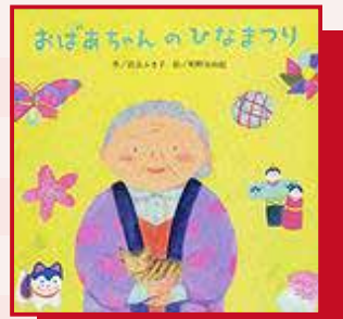
『おばあちゃんのひなまつり』

きょうは、ひなまつり。何やらにおいにさそわれて、山からやまんば やってきた。さあさあまつりをやろうじゃないか！ねている五人ばやしをたたきおこし、三人かん女にダンスをおどらせ、やまんばもいっしょにおどり出すうち、家のみんながおきてきて…。