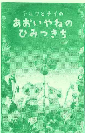
チュウとチイの あおいやねの ひみつきち