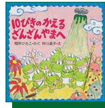
『10びきのかえる ざんざんやまへ』

せかいにほこるべき「地きゆうのたからもの」としてせかい文かいさんにとろくされたふじ山。その地理、れきし・文か、どうしよくぶつ、と山などについて、はく力のあまるしゃんとわかりやすいイラストで、明かいにかいせつします。ふじ山のみめ知しきもけいさい。