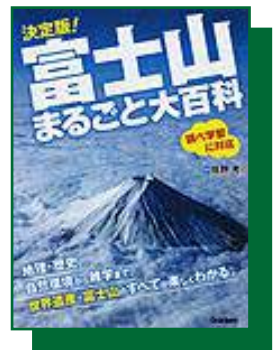
『決定版! 富士山まるごと大百科』

8月11日は「山の日」です。きょねんからはじまった新しい国みんのしゆく日です。山に親しみ、山からのめぐみにかんしゃする日ですので、山にかんする本を集めててんじします。