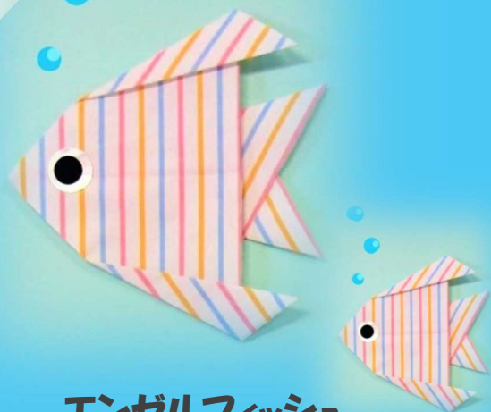
エンゼルフィッシュ